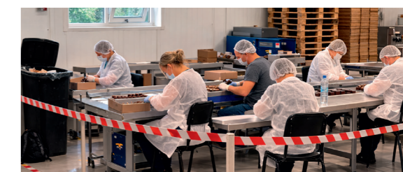
Tijdens de opleiding zoeken maatwerkers op deze foto 8 fouten op vlak van kwaliteit en hygiëne.

Zo versterken we bij Lidwina vakmanschap, aandacht voor elkaar, respect, ontwikkeling en betrokkenheid. En dat maakt werken bij Lidwina fijn; ook voor Yvan, die in september zijn job bij Colruyt inruilde voor zijn droomjob als maatwerkbegeleider.